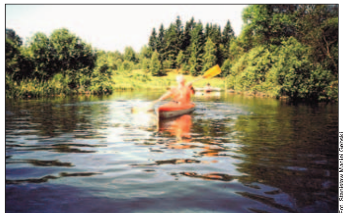
Na szlaku Weli między Tarczynami a Lidzbarkiem Welskim.

23,0 – most drogi lokalnej łączącej Mroczo z Trzcinem. Poniżej po około 300 m wysoka kładka. Z prawej strony las, potem teren bezleśny, brzegi zadrzewione. Po kilkuset metrach znowu spotyka-