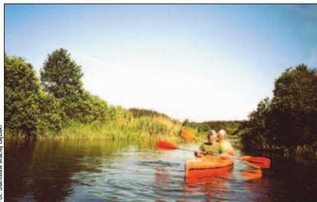
Na szlaku Weli między Tarczynami a Lidzbarkiem Welskim.