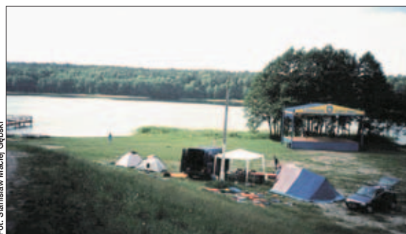
Biwak nad Jeziorem Lidzbarskim w Lidzbarku Welskim.

54,4 – wpływ Weli z jez. Zakroc, znow rzece zaczynają towarzyszyć lasy. Po niespełna 2 km dopływamy do bardzo ładnego miejsca biwakowego. Po lewej stronie mijaliśmy projektowany rezerwat „Ostoje Koszelewskie”, niewielki przytopiony drewniany mostek (kajaki przeciągamy nad mostem) przed wsią Koty. Zagospodarowane po-