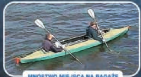
MNÓSTWO MIEJSCA NA BAGAŻE