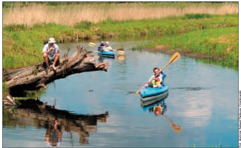
Na szlaku Gołdapy.

M inęło kilka miesięcy... Nadszedł długi weekend majowy. Z dwoma potencjalnymi kandydatami na spływowiczów pojechaliliśmy na Mazury. Przy okazji na kilka godzin wybraliśmy się nad środkowy odcinek Gołdapy. Rzeka nie wyglądała na groźną. Nurt miejscami dość bystry, ale nie przesadnie. Obejrzeliśmy jedną elektrownię wodną – normalna, choć nieco uciążliwa, przenoska przez zaporę. Jadąc wzdłuż koryta wypatrywaliśmy rzeki z okien samochodu. Widać było sporo głazów bielących się nad powierzchnią wody; przypomniał mi się fragment mówiący o górskim charakterze tego odcinka. Bliżej Gołdapy widać było rzekę silnie meandrującą wśród łąk. Wniosek był jeden: rzeka jest uciążliwa, ale na pewno do przepłynięcia – przyjeżdżamy za miesiąc na spływ.