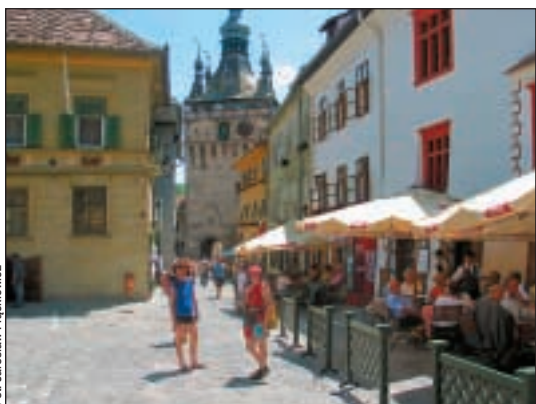
Wieża zegarowa w Sighisoarze.

Wieczorem zaprosiliśmy gospodynię na wino do siebie, na łączkę przy namiotach. Gospodyni ściągnęła koleżankę. Na trawie w cieniu śliw, próbując rozmawiać po francusku, rosyjsku i na migi, wczuwaliśmy się w lokalne klimaty. Największym sukcesem imprezy było nauczenie się rumuńskiej piosenki. Przy kolejnych spotkaniach śpiewaliśmy ją, zdobywając serca Rumunów.