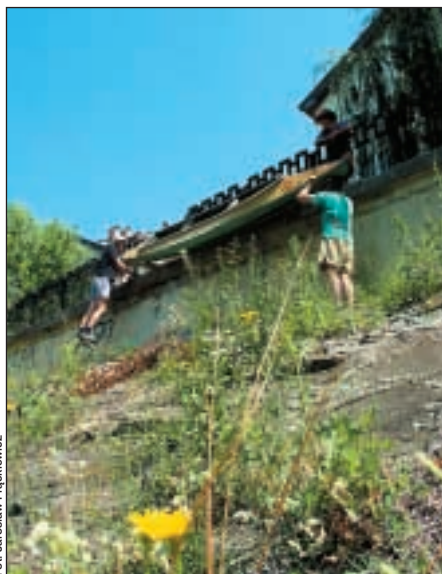
Zejscie na wodę w Sighisoarze.

Następnego dnia rano w ogródku złożyliśmy kajaki i ruszyliśmy w czwórkę na zwiedzanie Sighisoary. Stary gród na wzgórzu zachował autentyczną średniowieczną zabudowę wraz z murami obronnymi i basztami, co więcej – zabytkowe domy są zamieszkałe. Miasto jest wpisane na listę światowego dziedzictwa kultury UNESCO. Z satysfakcją obserwowaliśmy zadbane elewacje starych domów, czerwone pelargonie zawieszane na murach. Razem z nami te wspaniałości podziwiali tłumy turystów zapelniające wąskie uliczki. Naszą radość dopełniło piwo wypite w eleganckiej restauracji na rynku, o dziwo, w niewiarygodnie niskiej cenie, w przeliczeniu 2 zł za kufel.