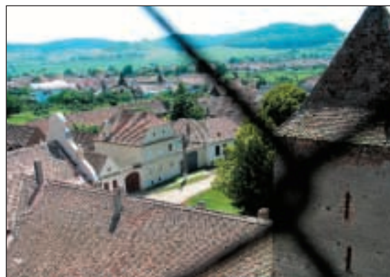
Widok z zegarowej wieży warownego kościoła w wiosce Braiteiu.