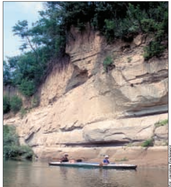
Widoki na Wielkiej Tyrnawie.