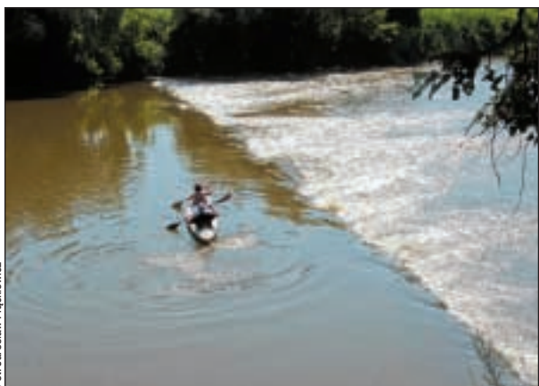
Próg przed Alba Iulia.

majdanu! Zadowoleni, rozbawieni i szczęśliwi z udanej misji szybcieutęko wracamy nad rzekę.