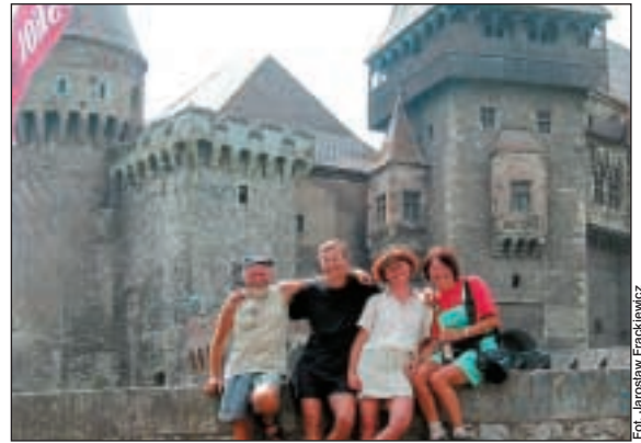
Szczęśliwe zakończenie spływu – zamek w Hunedoarze.

Wysokie, strome skarpy Wielkiej Tyrnavy nie czyniły jej malowniczą w pierwszych dniach spływania. Czuło się, że dalej ciągną się pasma gór, ale poza zakrzaczonymi brzegami nic interesującego z rzeki nie dało się zobaczyć. Dno Tyrnavy po wielokroć stawało się skalistą płytą. Powodowało to, że woda – i tak już dostatecznie szybka – przedzierając się przez kamieniska formowała szpoty lub spadając uskokiem czy nawet całymi grzędami uskoków tworzyła szeregi malowniczych, choć zdradliwych „baranów”. Kajaki w takich sytuacjach sprowadzali-