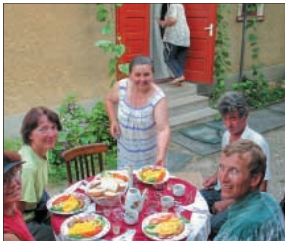
W gościnie u rumuńskiej rodziny.